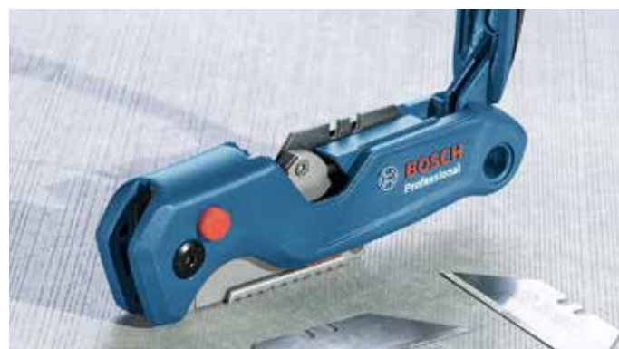
替刃を収納した状態